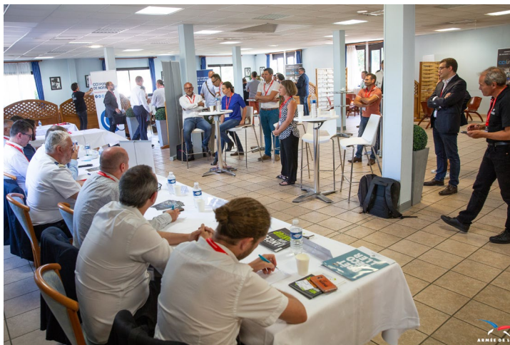
À la base aérienne 105 d'Évreux, «CCI Linkhub Normandie», jury de sélection des start-up les plus innovantes.

Lancé à l'initiative de la CCI Portes de Normandie à Evreux, le «CCI Linkhub Normandie» est le concept innovant qui permet aux start-up de disposer de moyens humains et de matériels pour se développer plus rapidement et aux entreprises de gagner en agilité, d'être performantes et compétitives pour s'adapter à un environnement mouvant.